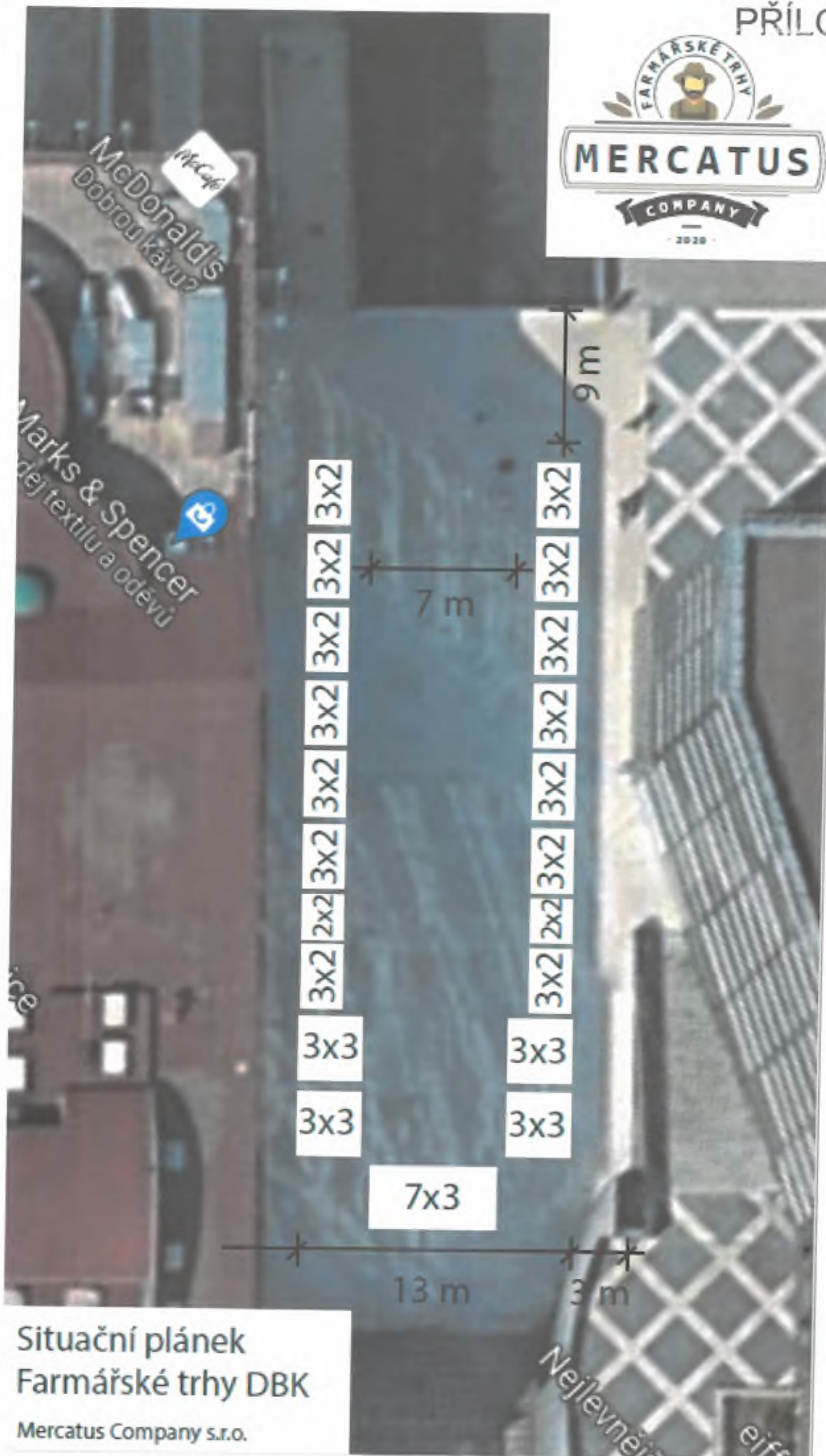
Situační plánec Farmářské trhy DBK